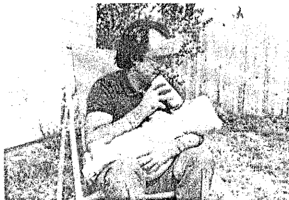
Boulder, Colorado (1970): servicios públicos y teoría del crecimiento.